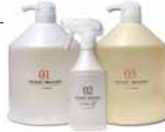
サロントリートメント (業務用)

*2 ラメラ液晶構造とは、毛髪表面に水分と油分の層がバランスよく何重にも重なった状態をいい、ラメラ液晶構造が整った毛髪表面はバリア機能が高く、保水性を有します。