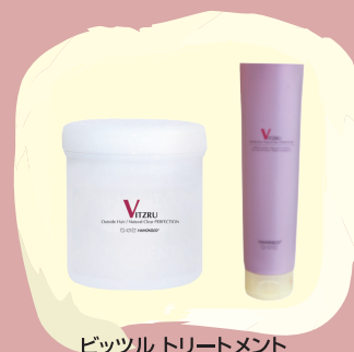
ビッツル トリートメント