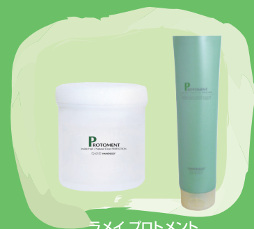
ラメイ プロトメント